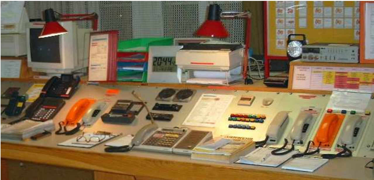
Ein Blick auf das Bedienpult für Telefon, Notruf, Funk etc.

Die Bezirksalarmzentrale (BAZ) Zwettl nimmt Notrufe aus dem gesamten Bezirk Zwettl entgegen. Unterstützt durch moderne Alarmierungstechnik und detaillierte Alarmpläne werden die 105 Freiwilligen Feuerwehren des gesamten Bezirks zentral von Zwettl aus koordiniert.