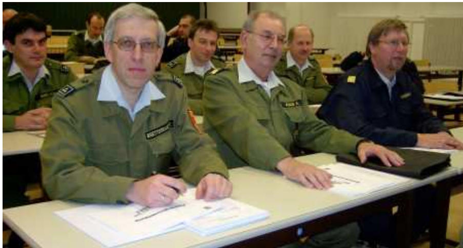
Die Verwaltungsfunktionäre aus dem Bezirk Zwettl drücken die Schulbank in der LFWS